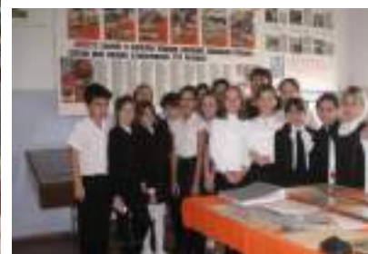
Посещение школьного музея