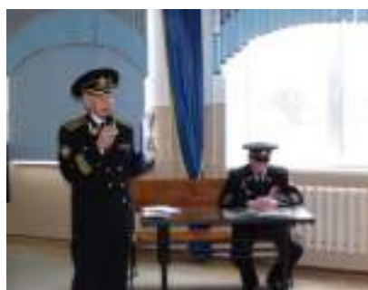
Классный час «Поклонимся великим тем годам!»