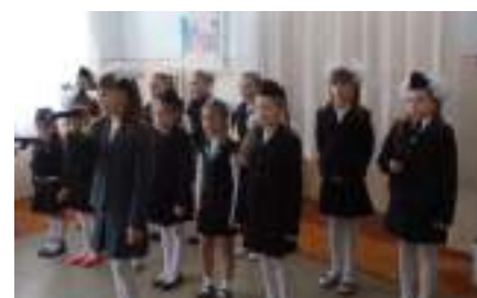
Школьный литературный конкурсе стихов «Годы, опалённые войной»

3 этап – рефлексивно-обобщающий Оформлен уголка «Живая память»