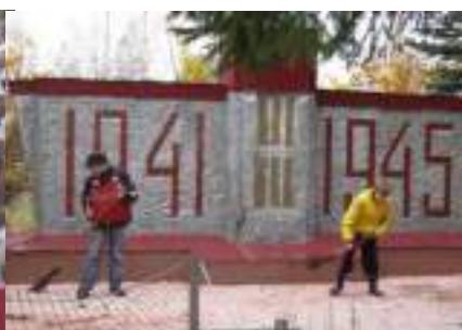
Уборка памятника воинам Великой Отечественной войны ст. Раздольной