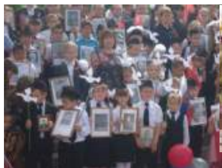
Акция «Бессмертный полк»