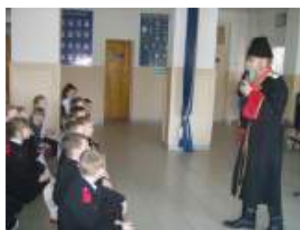
Атаманский час «Никто не забыт, ничто не забыто!»